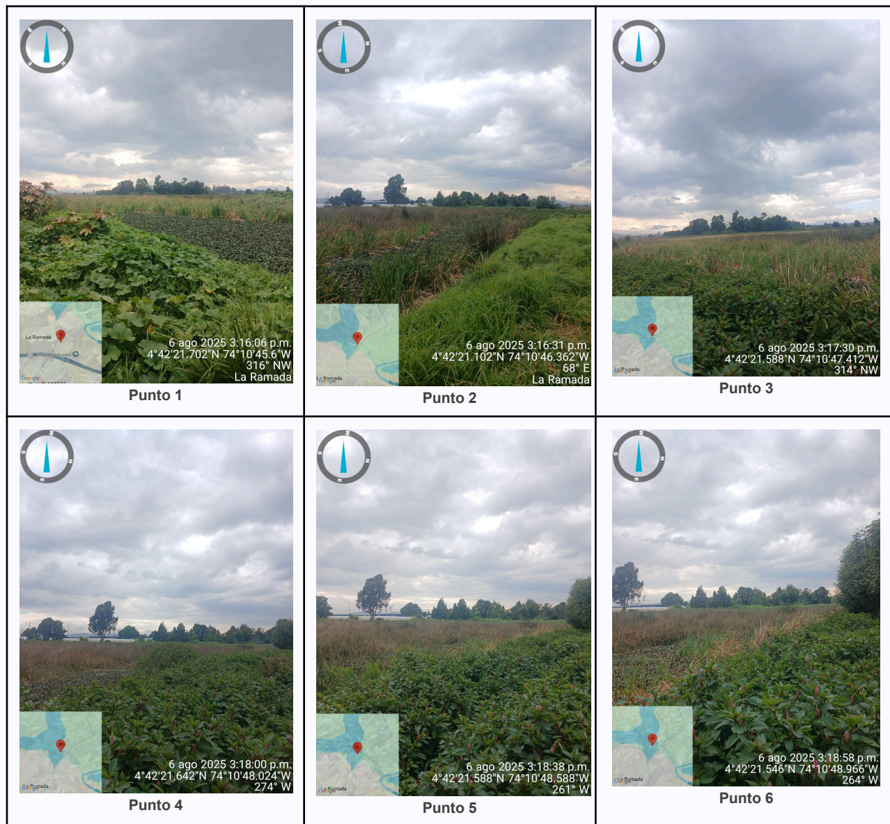
Ilustración 2. Fotos de los puntos del Recorrido de Control Y Vigilancia Ronda Del Humedal Gualí.